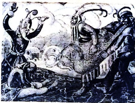
•Huaca y K'usillos, CO X 81 - 1937

llege (con refererncia a un artículo en "El Mundo", Santa Cruz, Agosto 10, 1993) Diego Rivera habló de él afirmando que fue "uno de los más originales de los pintores americanos". Ganó la Medalla de Oro de México, después de lo cual dejó el país y partió a la ciudad de New York.