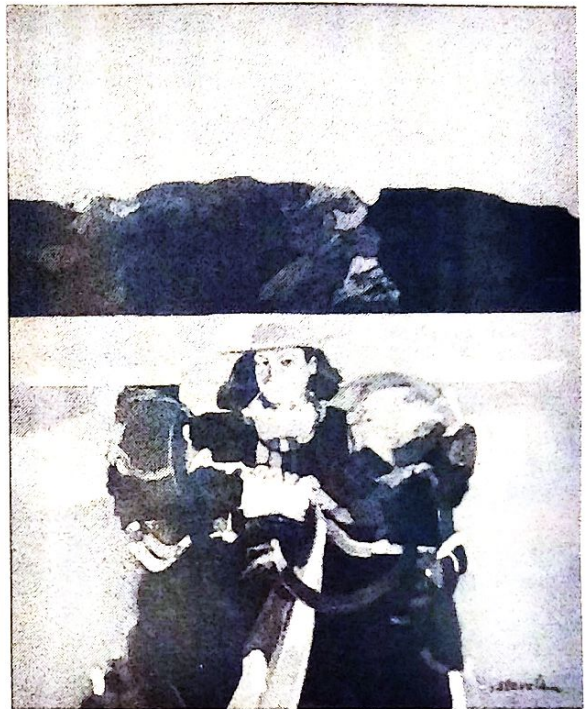
Erasmus Zarzuela «Memoria Calamarca» oleo.