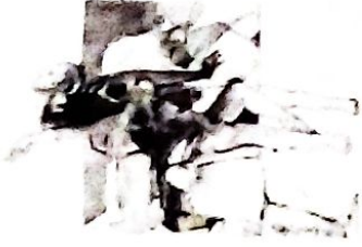
Erasmus Zarzuela: "La Piedad"