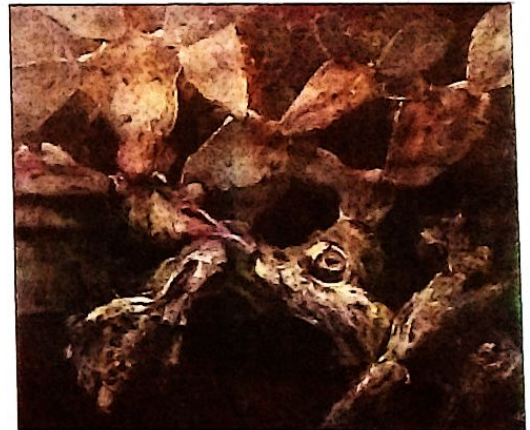
"Cactus" c. 1973. Cochabamba Oleo-Lienzo. 81 x 100 cms