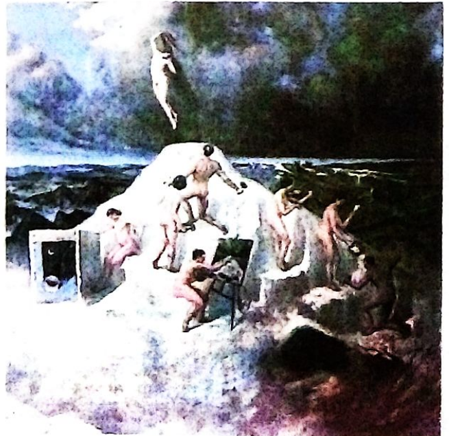
-Alegoría de la perfección de las artes- c 1945 La Paz. Óleo-lienzo. 157 * 155