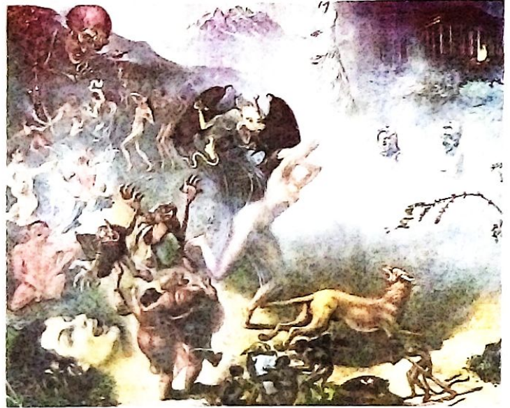
-Crítica de los ismos y triunfo del arte clásico- 1948 La Paz. Óleo-tiempo 119x142cm