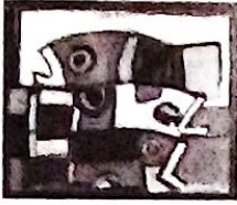
Erasmo Zarzuela: "Peces "