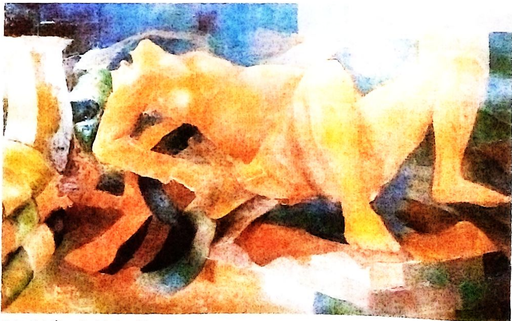
Maternidad. Óleo sobre tela 1m x 80 cm.