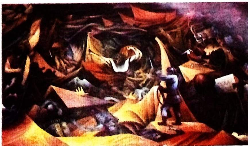
Pintura mural de Catavi «Liberación»