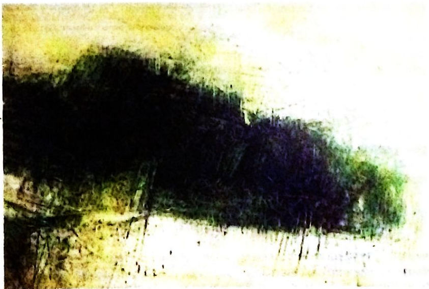
"Abstracto" Óleo sobre tela.