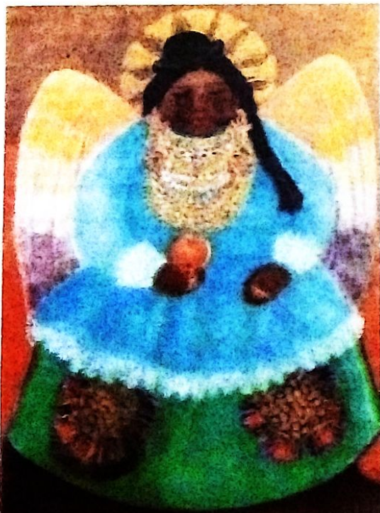
"Angélica" Óleo sobre tela.