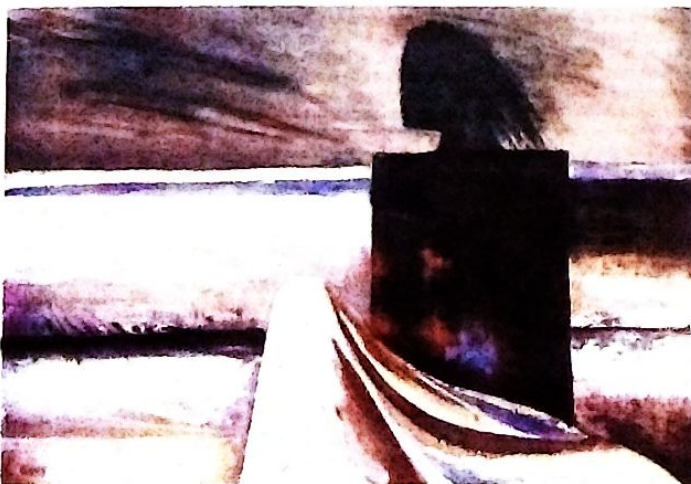
"La ventana abierta" Óleo sobre tela.