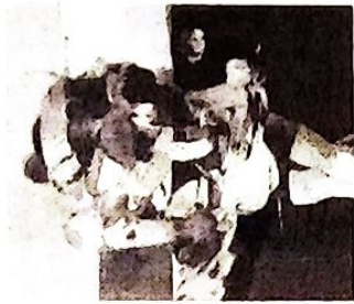
Erasmus Zarzuela Chambi "Fragmentos de la noche"