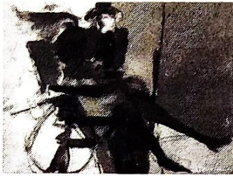
Eraso Zarzuela Chambi "Silla de ruedas"