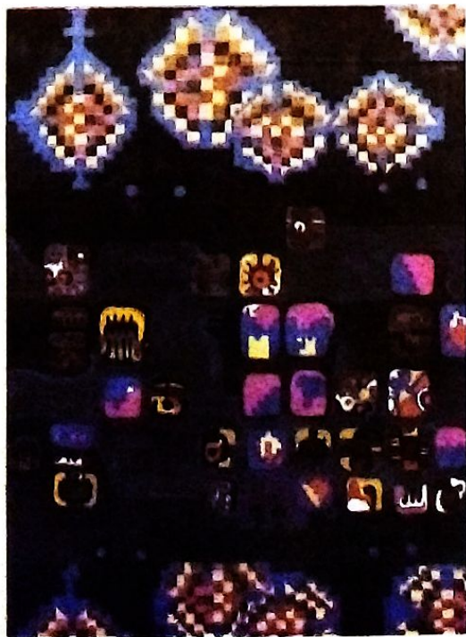
"Pictografía XXVII" (Pintura)