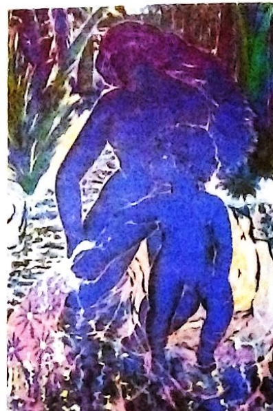
"Lavandera" Óleo 120 x 80 cms.