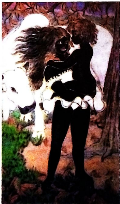
"Bajo el gallito - Óleo" - 127 x 200 cm.