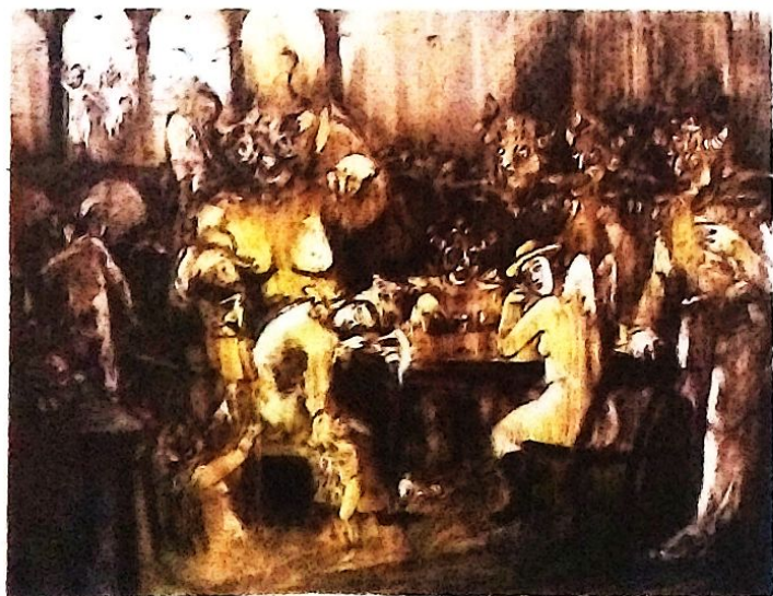
"Pepinos" - Acuarela 80 x 60