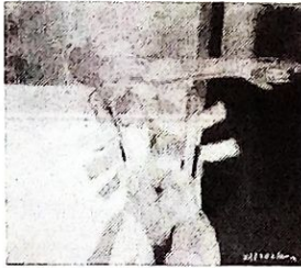
Erasmo Zarzuela Chambi Figura. Óleo 120 x 100 cms